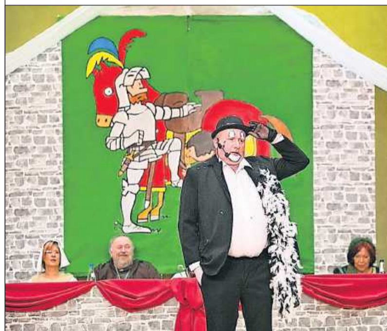
Närrisch geht's zurzeit überall zu: Unser Fotograf hat bei einer Karnevalssitzung in Katzweiler Fotos gemacht, unter anderem dieses hier beim Sportverein. Ins rechte Bild hat er sechs Fehler eingebaut.