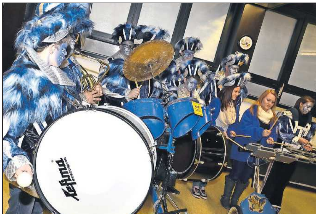
Geprobt wird das ganze Jahr über in einer Halle.

Meistens sind die Trommeln und Schlagwerke auch noch auf Räder montiert, damit die fröhliche Musikerschar lautstark durch die Straßen ziehen und bei Umzügen teilnehmen können. Gute Laune ist dann auch bei den Zuschauern garantiert, denn die Guggemusik ist so mitreißend, ja aufre-